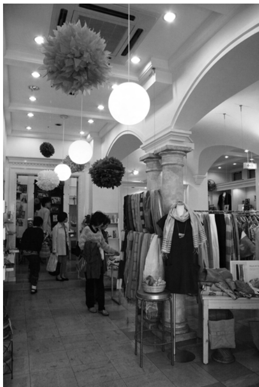
店舗内装も華やいだ雰囲気を演出