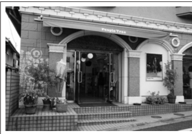
ピープル・ツリー自由が丘店。朝ヨガなどのワークショップも毎月開催