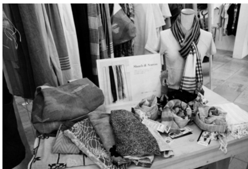
ナチュラルな質感と洗練されたデザインが持ち味

ピープル・ツリーといえば、フェアトレードのブランドとして今や不動の地位を占めつつある。搾取や児童労働、環境破壊などを伴わないフェア（公正）な取引という概念を日本に浸透させた立役者が、同ブランドだ。その旗艦店が、今年4月で開店15周年を迎えた。